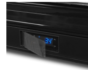
Regler mit Abdeckklappe